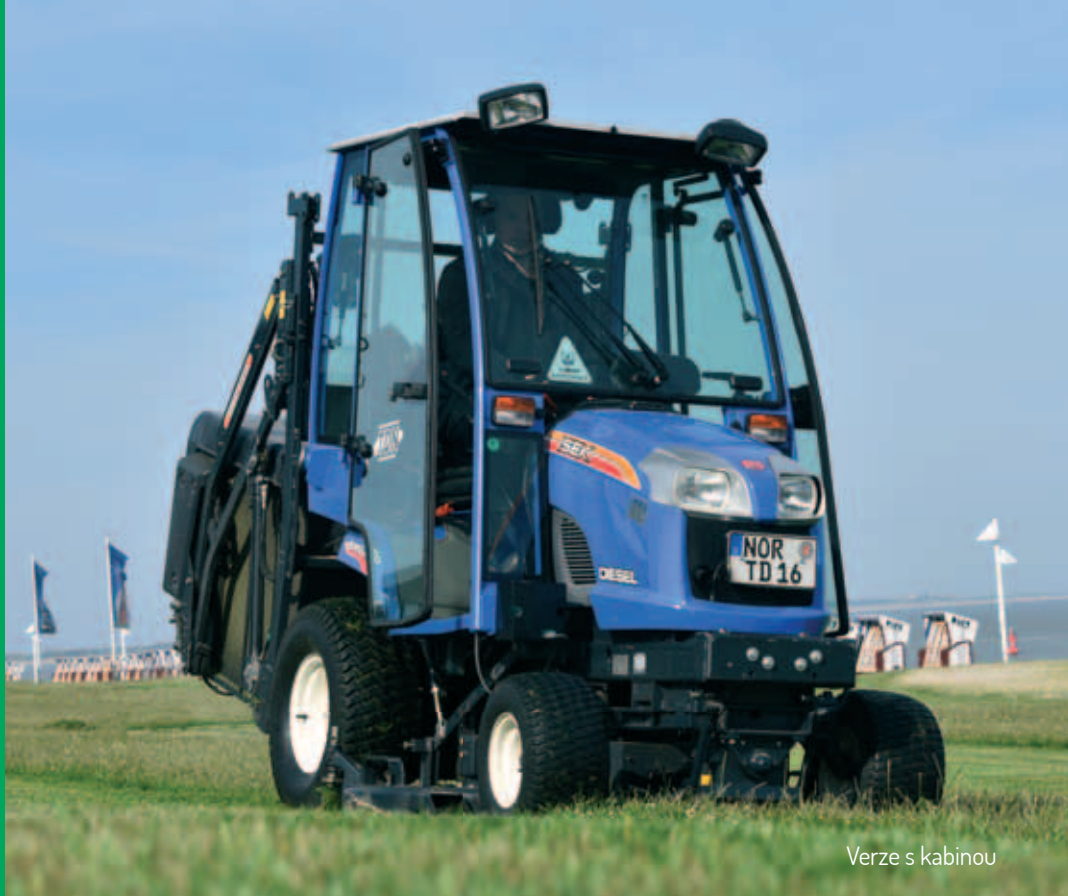
Verze s kabinou

Tráva? Sníh? Listí? Odpadky? Nový žací traktor SXG 3 dělá vše naplno. Byl vyvinut pro údržbu komunálních ploch a jeho hlavní předností je všestrannost. Za druhé má výkonný diesellový motor. A za třetí má hydraulický výklop na zem nebo do výšky. Stručně řečeno: Profesionalita po celý rok.