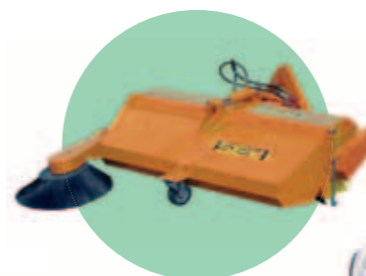
ZAMETAČ Čelní zametací kartáč s 1100 mm pracovní šířkou.

Originální pracovní nástavce ISEKI zaručují 100% kompatibilitu se strojem, což zaručí optimální pracovní výkon a snadnou manipulaci pro obsluhu.