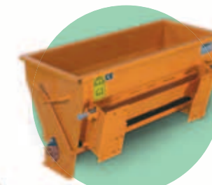
SYPAČ ISEKI nabízí volitelně válcový sypač nebo rozmetadlo poháněné hydraulicky, o celkovém objemu cca 100 ltr a s pracovním záběrem od 1 m.