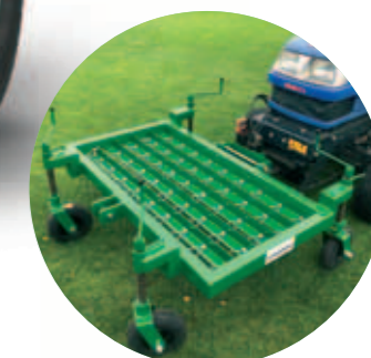
PROVZDUŠŇOVACÍ RÁM Čelně nesený, šířka 1100 mm, umožňuje vyčesaný materiál sebrat rovnou do koše